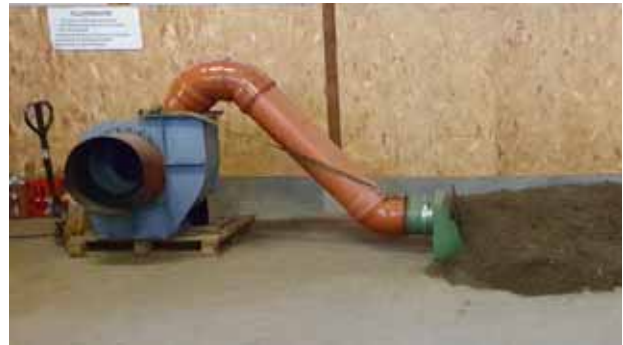
Trocknung der gewonnenen Saat

Text, Bilder und Fotos: Thorsten Rabeler