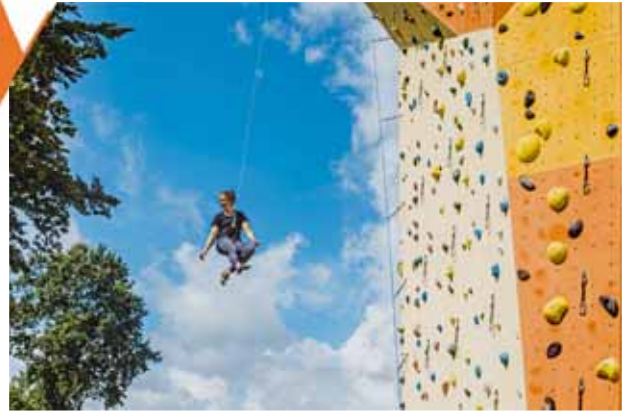
Kletterer beim Ablassen an der Außenkletterwand

„Seit April 2019 bietet die KletterBar Kiel mit rund 2.600 m 2 Kletterfläche und 16 Meter Höhe eine moderne Kletterhalle für den Norden Deutschlands. Die Halle in Melsdorf ist komplett auf die Bedürfnisse von Sport- und Freizeitkletterern zugeschnitten sein. An einfachen Routen sowie in abgetrennten Schulungsbereichen können Anfänger erste Kletterzüge üben und Fortgeschrittene an ausladenden Überhängen ihre Grenzen erweitern. Darüber hinaus ermöglicht ein 750m 2 großer Boulderbereich das Klettern ohne Gurt und Seil in Absprunghöhe. Auch ein großer Außenkletter- und bald auch Boulderbereich (Eröffnung Sommer 2022) lässt keine Wünsche offen.