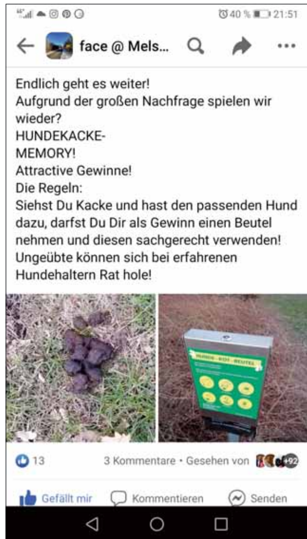
Screenshot von Peer Vollbeh

Text und Foto von Alexandra Pfaff und Meicken Thode