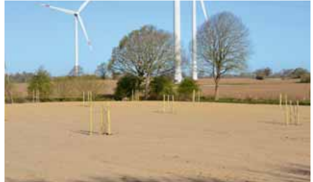
bestellte Fläche mit Wildobstpflanzung