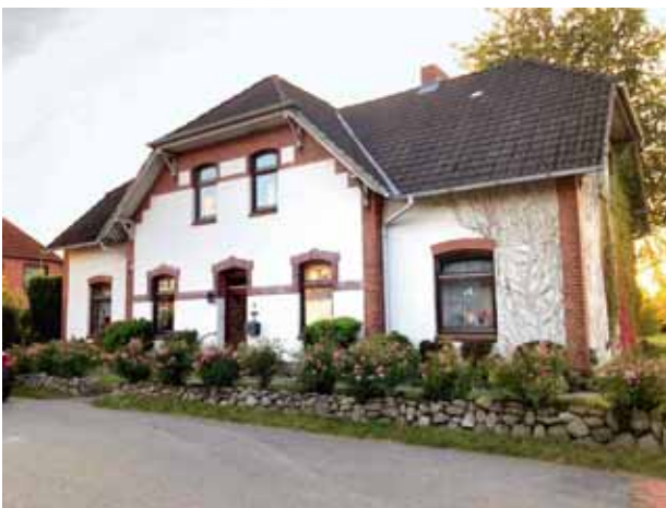
Melsdorf, Bahnhofstraße 2 – errichtet 1907

Elliott Wagenknecht, Melsdorf, Bahnhofstraße 2 – Ecke Dorfstraße – fand dieses etwa 15 cm lange beschriftete Holzstück bei Renovierungsarbeiten im Obergeschoss ihres Hauses unter einem alten Bretterfußboden.