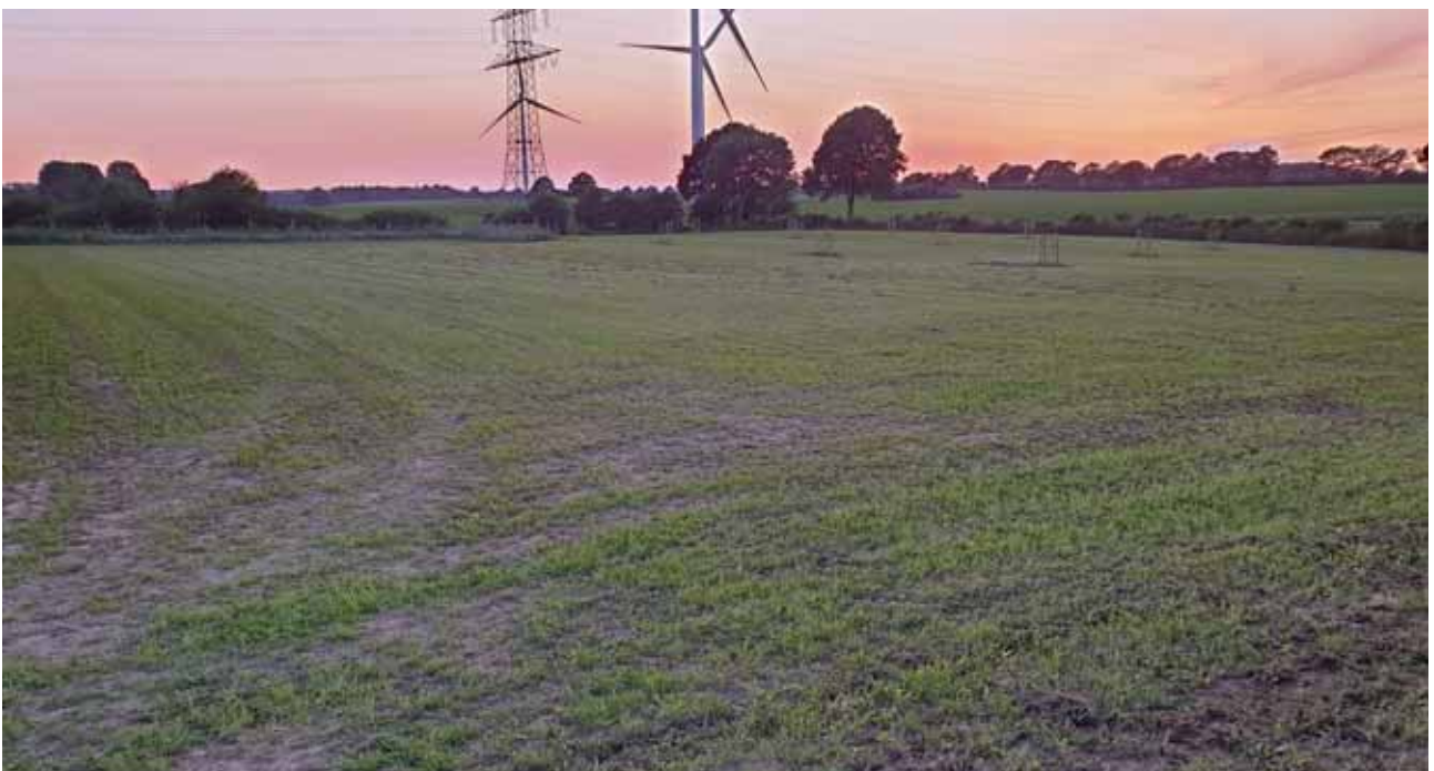
Erste Schröpfung am 22. Juni 2020