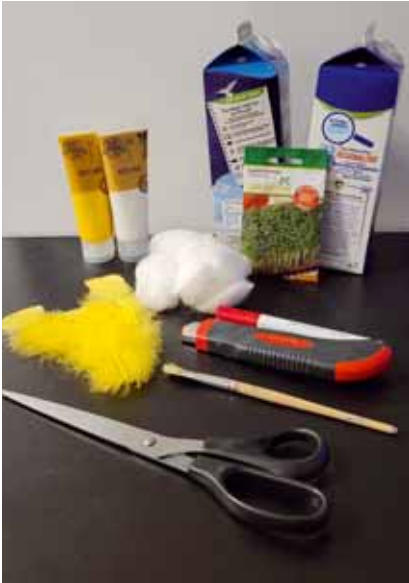
Osternest aus Tetrapak