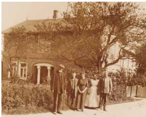
Wittschap Aufnahme etwa 1910