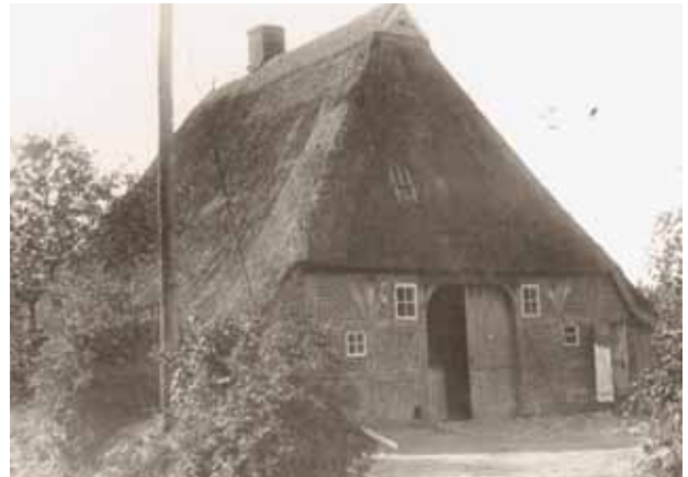
Aufnahme: Etwa 1935