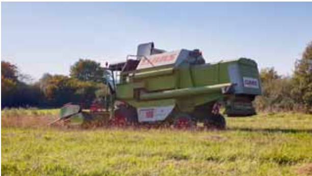
Ernte am 10. Oktober 2021

Haben Sie Interesse an einer Führung, Fragen zu örtlichen Umwelt- und Naturschutzprojekten, oder möchten Sie weitere Hintergründe zur Jagd vor Ort erfahren, so wenden Sie sich gerne an: