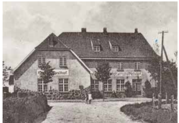
Aufnahme etwas von 1924