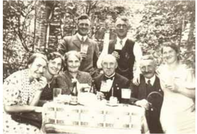
„Wer Dag för Dag sien Arbeit deit, un ümmer op'n Posten steiht, un deit dat goot un deit dat gern, de kann sik ok mol amüseern!“