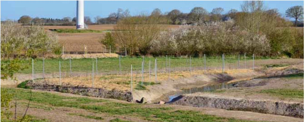
Anlage Gewässer als Seitenarm mit Gebüschfläche